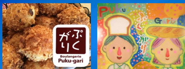
手作りパン屋ぷくがり